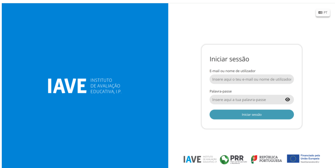
Figura 1 – Acesso à Plataforma de Realização das Provas Eletrónicas do IAVE

( Obs.: Para as escolas que optaram pelo offline em rede ou standalone, os procedimentos para acederem à Plataforma de Realização das Provas Eletrónicas do IAVE irão ser oportunamente divulgados)